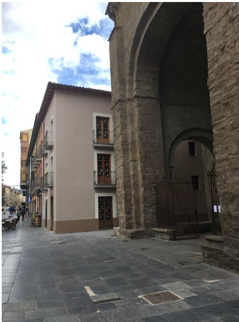
La puerta de la Catedral