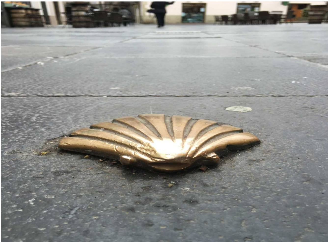
La plaza San Pedro de Jaca