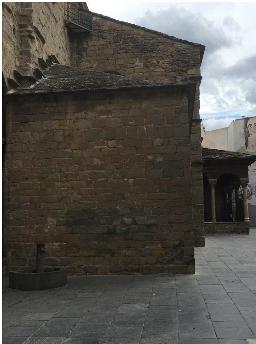
La plaza de la Catedral