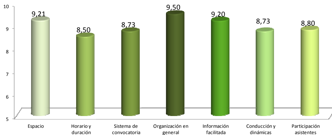
Valoraciones asistentes. Taller 7. Usuarios (15 cuestionarios)